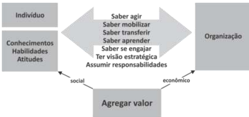
Figura 1 – Modelo de competências baseado em valor

Entende-se, pois, que o trabalhador é um ser pensante, vibrante e que poderia colaborar com suas competências para o desenvolvimento das ações desenvolvidas nos novos modelos de organizações baseadas na informação.